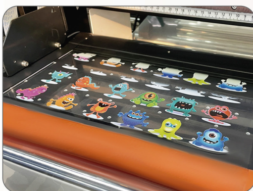
Rodillos de goma