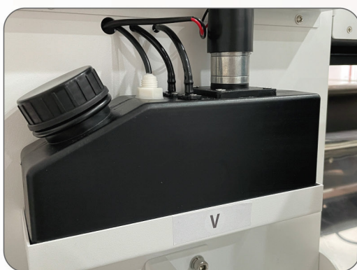
Agitado del barniz