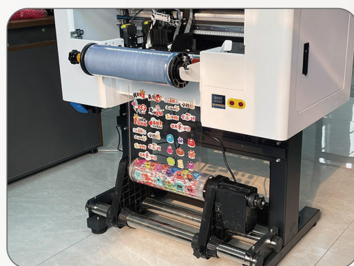
Sistema de recolección Frontal